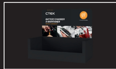
PDQ-Halterung mit Werbeplakat