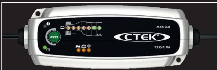
MXS 3.8 Batterieladegerät und -erhaltungsgerät.