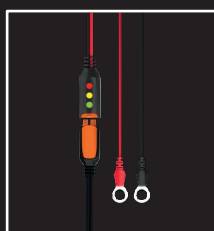
Indicator Eyelet M6